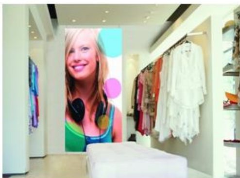
Pannello magnetico con grafica stampata su foglio metallico