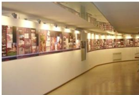
Sistema espositivo realizzato con gomma metallica e grafica su fogli e carta magnetici.

Può essere fornita con frontale grezzo, in PVC bianco o adesivizzato, si presta all'utilizzo sia interno che esterno. La giusta scelta per realizzare superfici piane o curvilinee per sostenere ogni tipo di magnete.